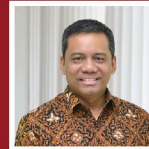
Suahasil Nazara (Kepala Badan Kebijakan Fiskal Kementerian Keuangan)