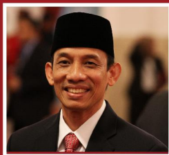
Arcandra Tahar (Wakil Mentri ESDM)