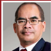
Amien Sunaryadi (Kepala SKK Migas)