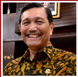
Luhut Binsar Panjaitan (Menteri Koordinator Bidang Kemaritiman)