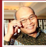
Djoko Siswanto (Direktur Jenderal Minyak dan Gas Bumi)